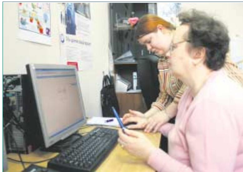
Бесплатные компьютерные курсы для пенсионеров в ГБУ «ТЦСО «Восточное Измайлово» филиал «Северное Измайлово».

предоставлении инвалиду реабилитационных мероприятий, технических средств реабилитации и услуг, входящих в федеральный перечень, утвержденный распоряжением Правительства Российской Федерации от 30 декабря 2005 г. №2347-р (при необходимости);